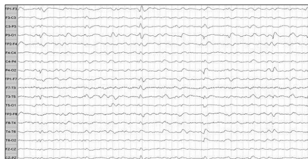
Figura 1. EEG digital 4º día de Hospitalización.

hospitalización en Servicio de Neurología de HCHM para estudio. A su ingreso, presenta examen físico general sin alteraciones, examen neurológico, vigilia consciente, atento, orientado tiempo espacialmente, Glasgow 15, de buen humor; memoria a largo y corto plazo conservadas, bradipsíquico, funciones encefálicas superiores conservadas. Al examen de pares craneales, diplopía mayor a izquierda sin otra alteración. Examen motor, tono normal, trofismo conservado, fuerza conservada; marcha atáxica, dismetría izquierda; sin alteraciones sensitivas. Signos meníngeos negativos. Dada la clínica se sospecha un ECJ o una encefalopatía tóxica metabólica inespecífica, se solicita un electroencefalograma (EEG) y una punción lumbar (PL) para proteína 14-3-3.